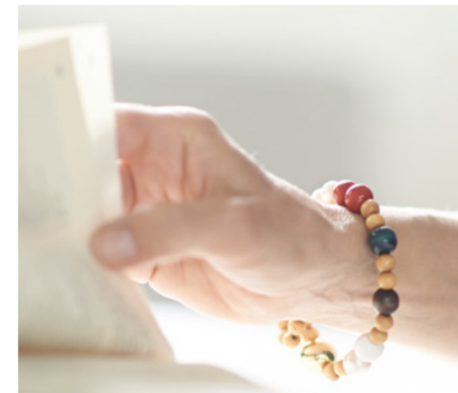
Kristuskransen er et smykke, men også et pædagogisk værktøj, der bruges i katekumenatet. Kransen kan blandt andet bruges, hvis man ikke ved, hvordan man skal komme i gang med at bede.

dernæst blev hun ”medvandrer”, som det hedder, når man deltager for anden gang, og nu er hun leder af den ene af to samtalegrupper.