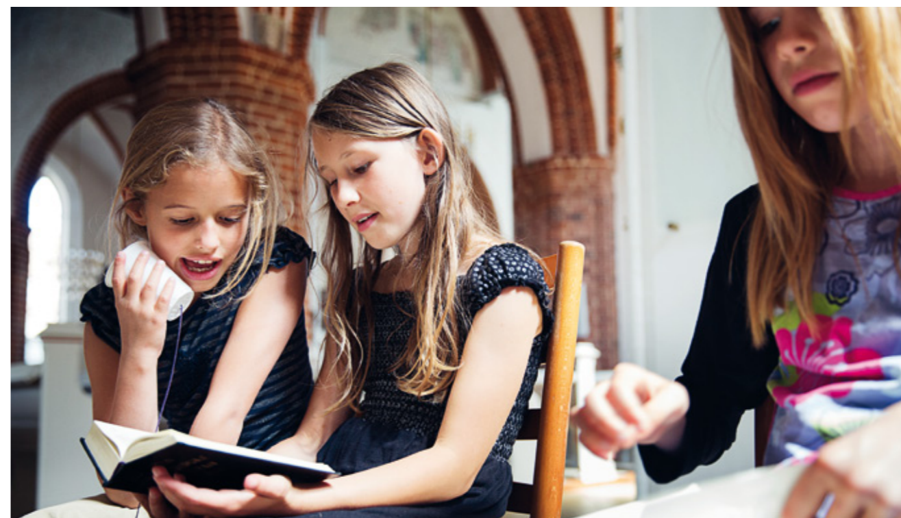
Hver dag har minikonfirmanderne andagt, hvor de lærer salmer og bønner.

”Det kan være, at han er herinde, han er jo usynlig,” lyder det.