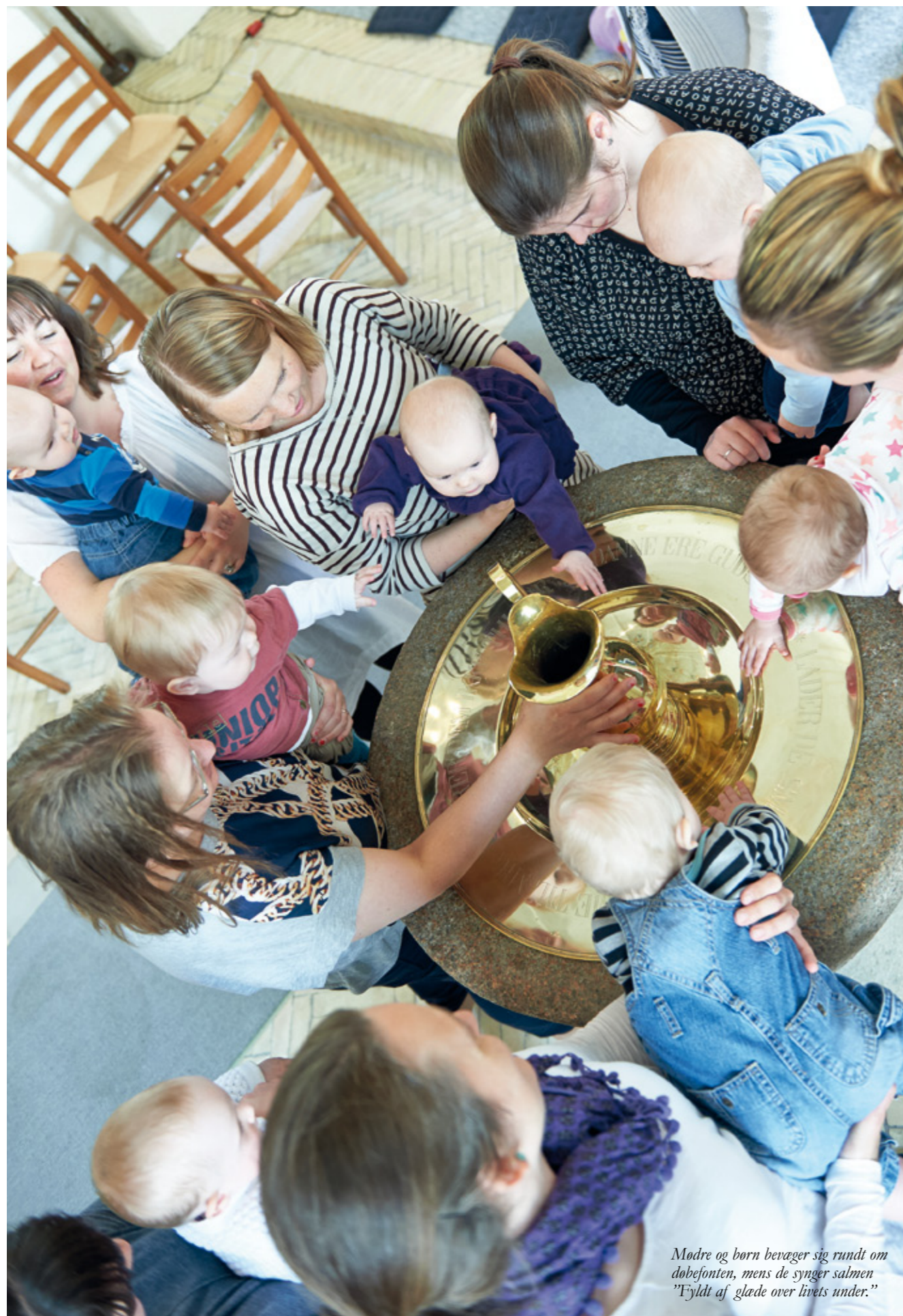
Mødre og børn bevæger sig rundt om dobefonten, mens de synger salmen "Fyldt af glæde over livets under."