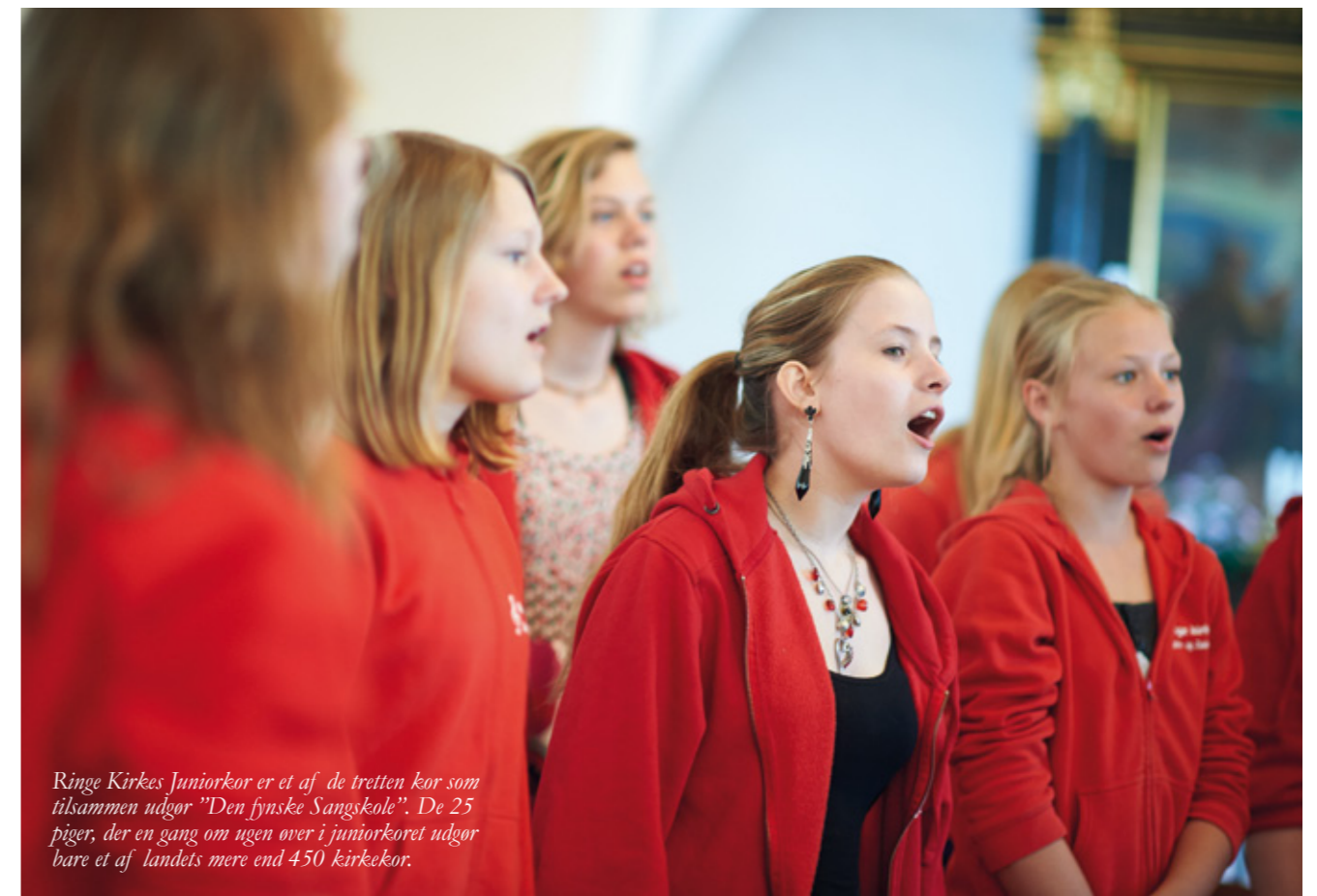
Ringe Kirkes Juniorkor er et af de tretten kor som tilsammen udgør Den Fynske Sangskole. De 25 piger, der en gang om ugen over i juniorkoret udgør bare et af landets mere end 450 kirkekor.