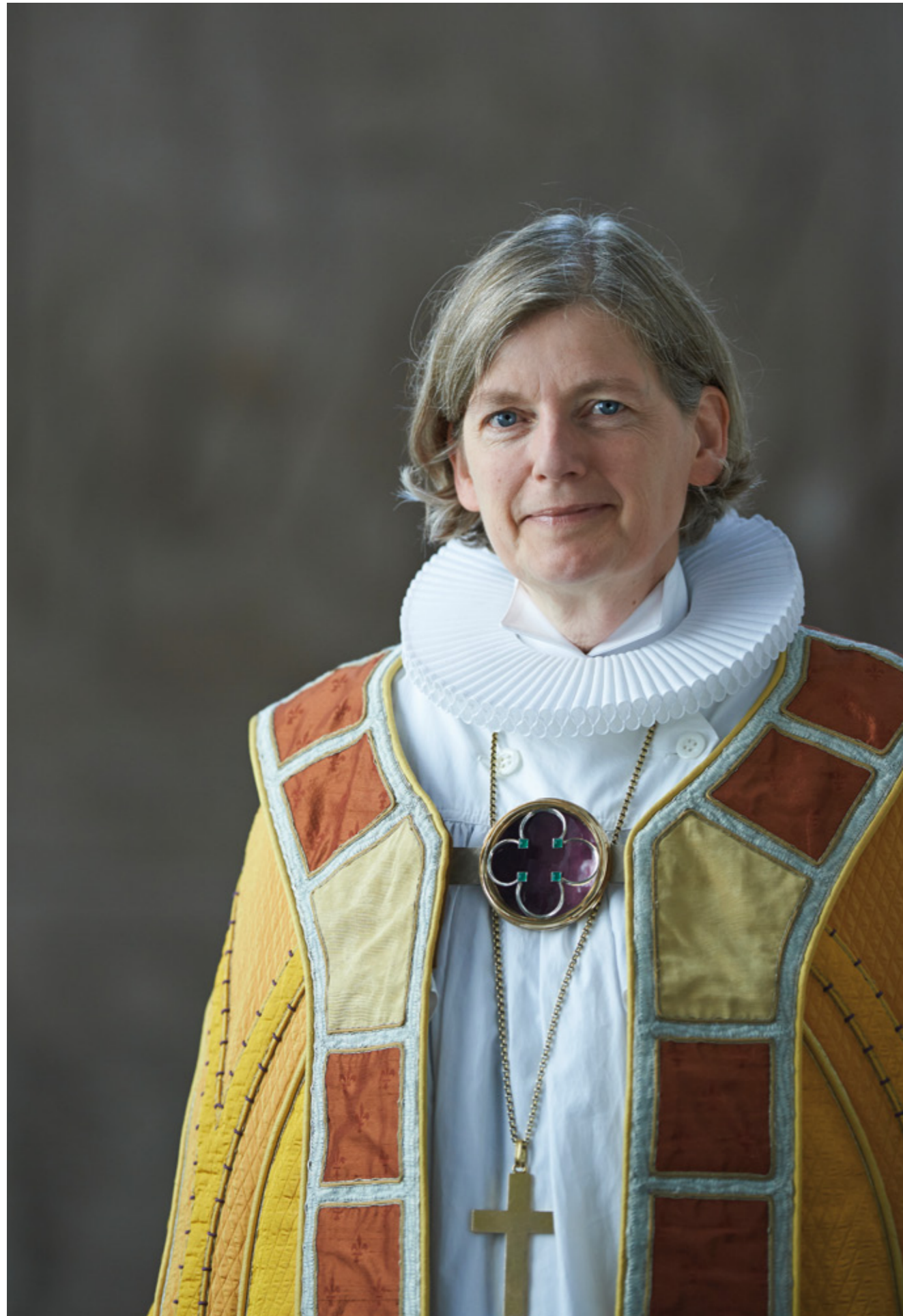
Biskop Tine Lindhardt