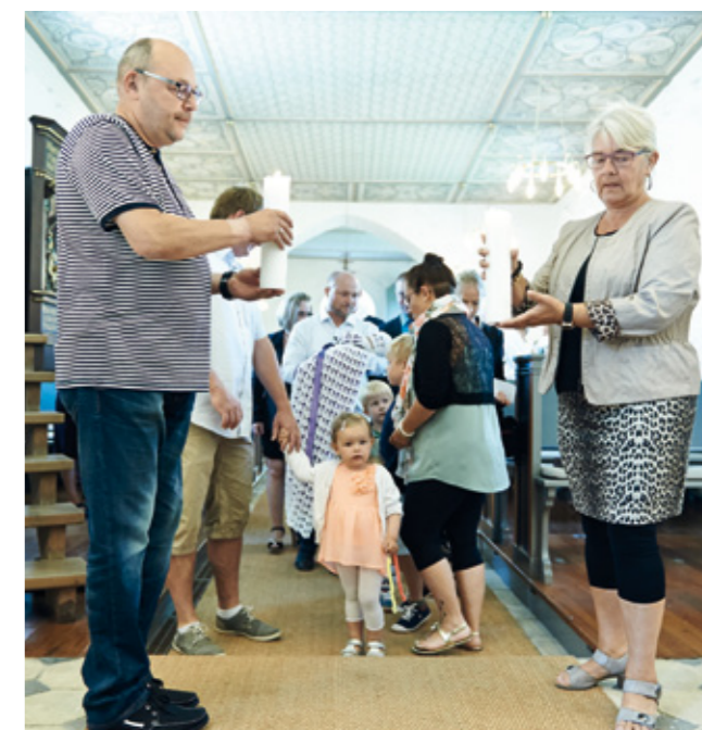
To af de frivillige overtager lysene fra dåbsprocessionen og sætter dem i alterstagerne.