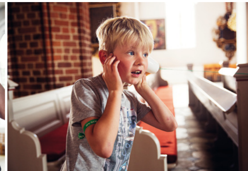
”Hallo, hallo!” Legen med hjemmelavede telefoner skal minde børnene om, at en bøn er ligesom en telefon til Gud.