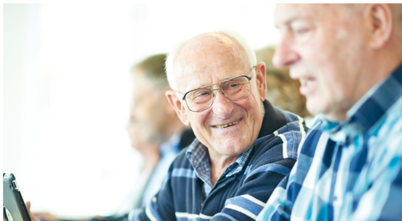
Ca. 12 kvinder og mænd deltog i IT-caféen i forårssæsonen.