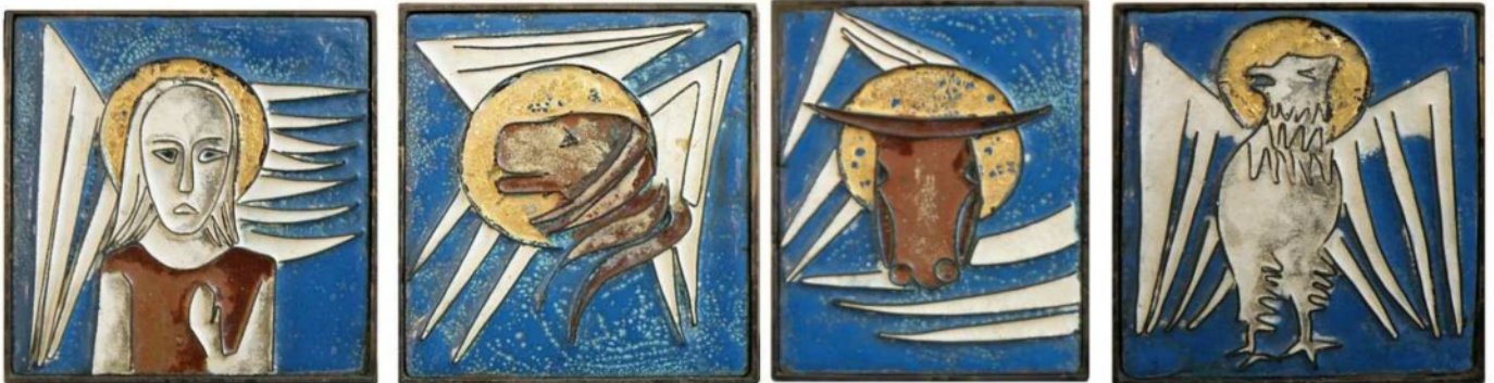
De fire evangelistsymboler på læsepulten i kirken på Dalum Kloster

Ved afbud senest tre dage før tilbagebetales beløbet.