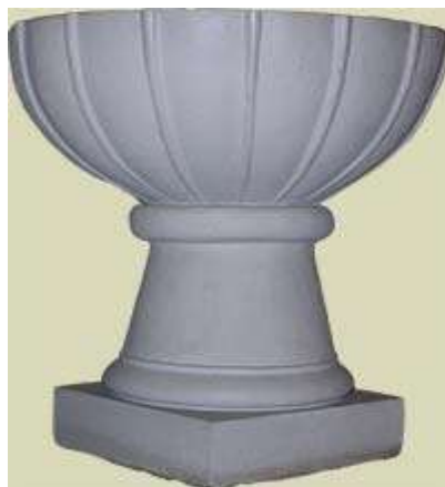
Døbefonten fik en kummerlig tilværelse efter Egense kirken i nabosognet Norup sogn blev revet ned i 1555, den endte som andetrug i den gamle præstegård i Egense, også kaldet "Annexgården", nu Egensegårdsvej 5.

kirkegård der de alleryngste og hvor den stadig anvendes. Kirkebjergsagnet kan naturligvis ikke berigtiges i at Hr. Knud boede i Ølund. Han synes blot at være en overgangsfigur mellem katolske munke og lutheranske præster. Måske passede Hr. Knud to kirker i Ølund og Skeby så det var praktisk at anbringe præstegården midtvejs i Skeby. Lidt senere sker der mon det sammen som i nabosognet Norup hvor præsten passer både kirken i Egense og i Norup; men hvor han forlader præstegården i Øster Egense, som bliver lagt ind under staten og snart overdraget til det nærmeste gods som i dag er Hofmansgave, da Egense kirken i 1550 blev revet ned 3 . Egense kirke var den kirke godset lod forfalde mest og den kom i alvorlige økonomiske problemer under reformationen. Så ifølge et dommerbrev ("klemmebrev") blev den befalet nedrevet i 1555 og omkring år 1600 blev den så nedrevet. En del af Egense kirkes kvadresten blev brugt til restaurering af Norup kirke; mens resterne blev brugt til pilotering af vejen mellem Egense og Hasmark hvor Egense Fjorden tidligere havde strakt sig ind. Døbefonden har sin egen interessante historie, som fortæber sig i den gamle Egense kirkes tilblivelse fra omkring år 1100. Den er hugget i gotlandsk kalksten. Døbefonten i Hasmark Kirke stammer fra den ifølge klemmebrev af 1555 nedrevne Egense Kirke 3 .