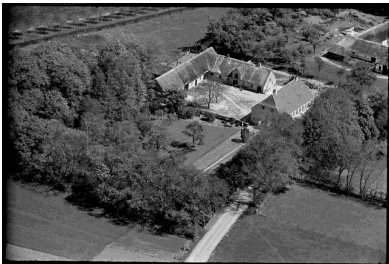
Skeby præstegaard. Foto 1936-1938